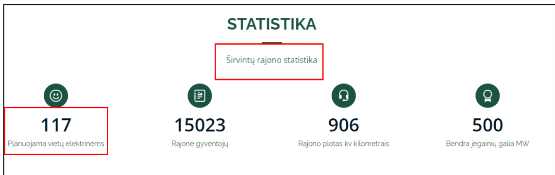
Pav. Nr. 2 - iškarpa iš Žalia žemė internetinio puslapio